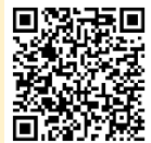
「ラーケーションの日」活動例